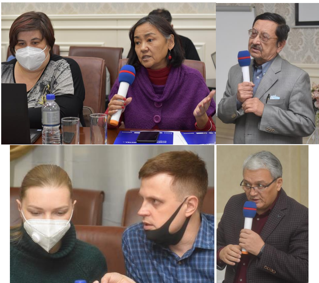
Маектешүү аянтчасынын дискуссиясы

- экинчи бөлүк талкуу жүзүндө уюштурулуп, айтылган маалыматтар талкууланып, катышуучулардын комментарийлери берилди. Чыгып сөз сүйлөөлөрдүн жана доклад жасоонун жүрүшүндө биздин өлкөдөгү экологиялык абалды жакшыртуу боюнча ар түрдүү сунуштар берилип, алар жакынкы аралыктагы иш-аракеттер планына киргизилди . Маектешүү аянтчасынын модератору тарабынан берилген сунуштардын негизинде жыйынтык чыгарылды.