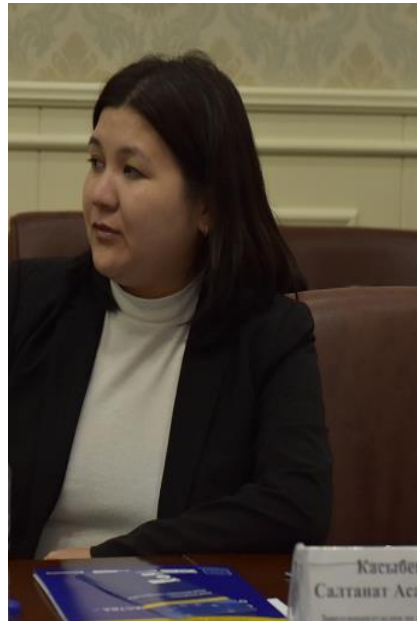
Касымбекова С.А, КР Акыйкатчы Аппаратынын социалдык-экономикалык жана маданий укуктарын коргоо бөлүмүнүн башчысы